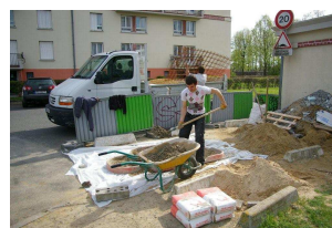
Quelques vues du chantier