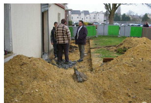
Quelques vues du chantier